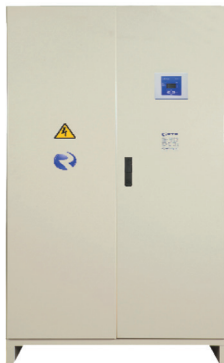
Sin interruptor de corte en carga